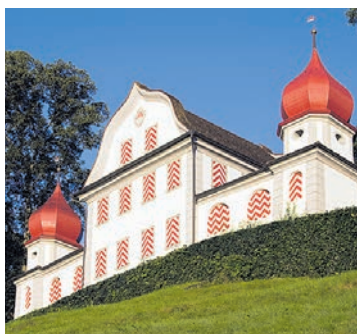
Landäbärg Unplugged Festival