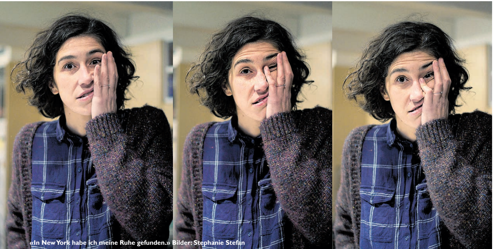
«In New York habe ich meine Ruhe gefunden.»

fektion nerve beim U-Bahn-Fahren, eröffne dafür in der Kunst neue Sichtweisen. Es bestehe eine Freiheit zum Dilettantismus, weil nicht alles unmittelbar bewertet werde: «Die amerikanischen Kunstschaffenden spielen viel selbstbewusster mit Genres, Kategorien und Formen. Die Abgrenzungen sind längst gegessen und überwunden.» Hier in der Schweiz verkrampten sich die Theaterleute hingegen immer noch häufig beim Versuch, die selbstauferlegten Regeln einzuhalten. Den amerikanischen Mut und die Selbstironie würde Meyer gerne hierherbringen.