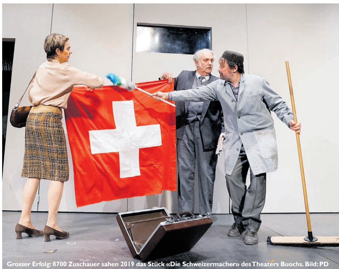
Grosser Erfolg: 8700 Zuschauer sahen 2019 das Stück «Die Schweizermacher» des Theaters Buochs.

Die grosse Bedeutung des Kollegium-Theaters zeigt sich nicht zuletzt auch in der Architektur. So verfügt beispielsweise das Alte Gymnasium in Sarnen über einen repräsentativen Theatersaal, der in der Zentralschweiz seinesgleichen sucht. Mit seinen zwei Galerien, getragen von neumanieristi-