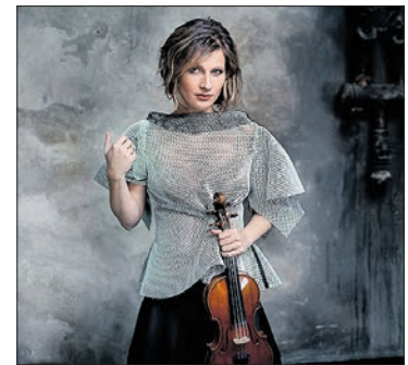
Bürgenstock-Festival mit Star-Besetzung www.buergenstock-festival.ch