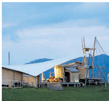
In Sauce getunkt