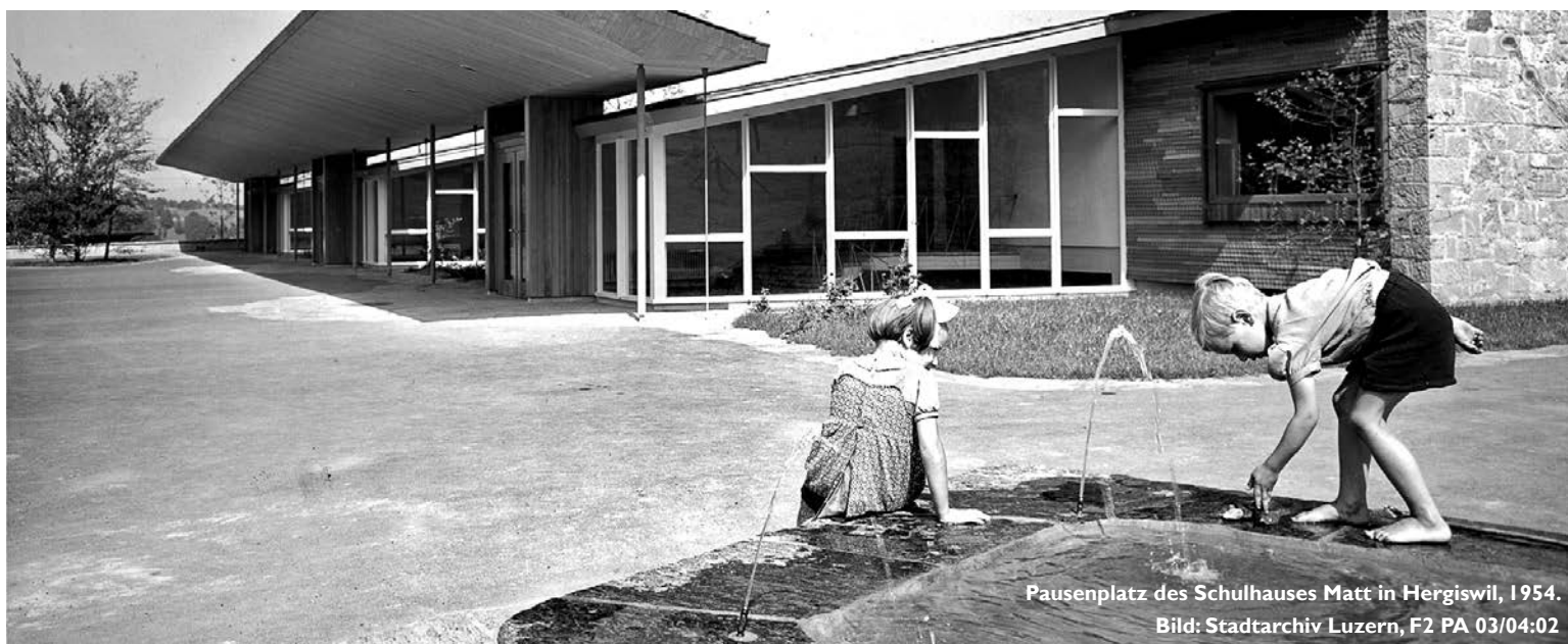
Pausenplatz des Schulhauses Matt in Hergiswil, 1954. Bild: Stadtarchiv Luzern, F2 PA 03/04:02