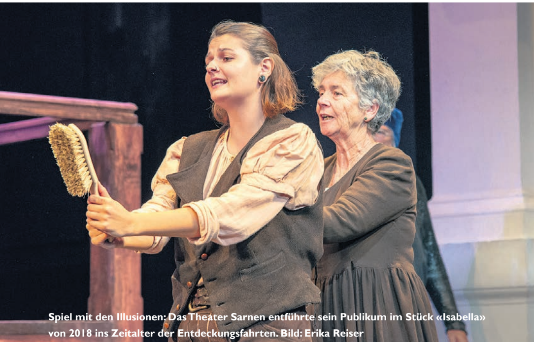
Spiel mit den Illusionen: Das Theater Sarnen entführte sein Publikum im Stück «Isabella» von 2018 ins Zeitalter der Entdeckungsfahrten.