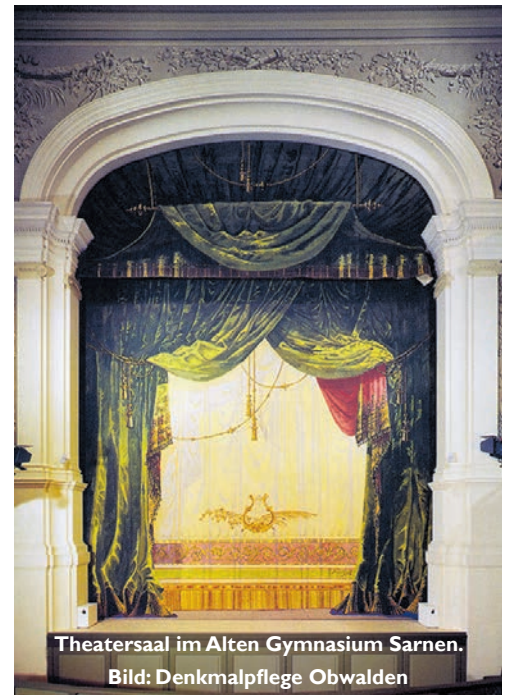
Theatersaal im Alten Gymnasium Sarnen.

schen Konsolen und einer imposanten Bogenöffnung zum Zuschauerraum von neun Metern Höhe, ist er ein Juwel unter den Kleintheatern. Alleine der Umstand, dass dieser Prachtbau 1891 in dieser Form realisiert wurde, unterstreicht den gesellschaftlich hohen Stellenwert der Schulbühne. Der Raum strahlt bis heute eine eigene Magie aus: Seine Beseelung scheint ein kollektives Bedürfnis und ein eminenter Motivationsfaktor für die lokale Theaterszene zu sein. Denn ja, so ein Objekt muss genutzt werden!