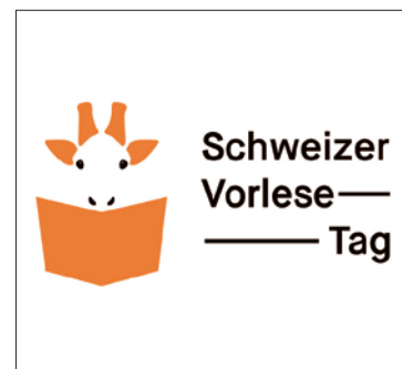
Schweizer Vorlesetag in der Kantonsbibliothek

www.kbow.ch/de/veranstaltungen/vorlesetag