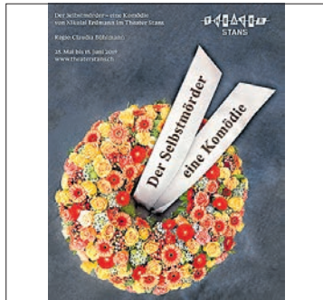
Der Selbstmörder www.theaterstans.ch