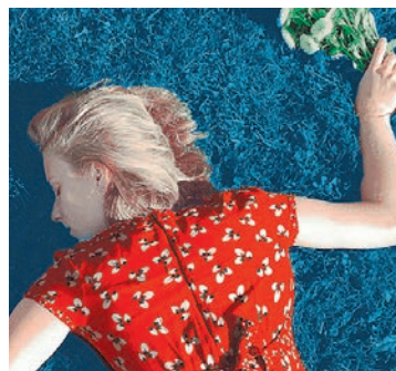
Out Of Time