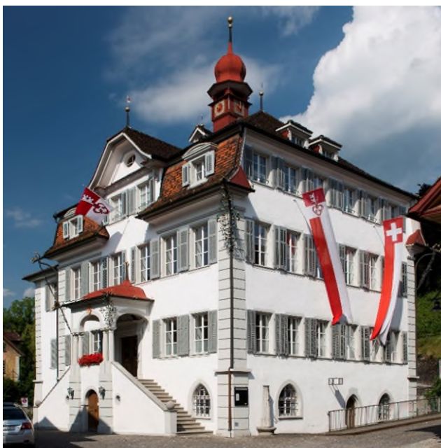
Das Rathaus am Sarner Dorfplatz. Darin tagen der Kantonsrat und der Regierungsrat. Landschreiberin oder Landschreiber, Staatskanzlei sowie das Amtsblatt- und Passbüro sind ebenfalls hier unterbracht.

Im Sommer 2023 wurde im Kantonsratssaal ein kombiniertes Mikrofon- und Abstimmungssystem mit zwei Monitoren eingebaut. Ebenfalls wurde ein WLAN installiert und bei jedem Platz Steckdosen montiert, damit die Ratsmitglieder auf ihren Geräten ihre Unterlagen digital abrufen können.