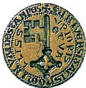
Stempel des alten Landessiegels aus dem 13. Jahrhundert, dessen ältester Abdruck am Bundesbrief von 1291 hängt.

Nach der Gründung des Bundesstaates erliess die Landsgemeinde 1850 eine total revidierte, mit dem neuen Bundesrecht in Einklang gebrachte Kantonsverfassung. Dabei wurde der Landrat als «Dreifacher Rat» eingerichtet. Dieser bestand aus den Vertretern der neu geschaffenen Einwohnergemeinden (ein Ratsmitglied pro 250 Einwohner, insgesamt 55), dem Regierungsrat und je einem weiteren Mitglied auf 125 Einwohner.