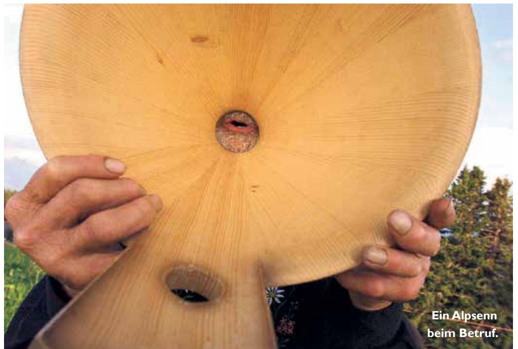
Ein Alpsenn beim Betruf.

Der Beitritt zur Unesco-Konvention verpflichtet die Schweiz, ein Inventar der lebendigen Traditionen nicht nur zu erstellen, sondern dieses auch periodisch zu aktualisieren. Dabei können bestehende Einträge bestätigt, angepasst oder gestrichen werden. Zudem besteht auch die Möglichkeit, neue Traditionen hinzuzufügen. Die Bevölkerung ist eingeladen, Vorschläge einzubringen. Das Bundesamt für Kultur oder die kantonalen Kulturstellen nehmen entsprechende Eingaben bis am 31. August 2016 entgegen. Die aktualisierte Liste wird voraussichtlich im Jahr 2018 veröffentlicht.