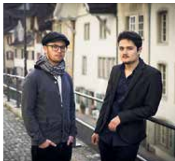
Dietiker/Dillier – «Planer & Flaneur» www.buecherdillier.ch

Am 11. Juni 2016 öffnet das Tal Museum seine Türen für die Werke des Benediktinerpaters Eugen Bollin (*1939). Im Zentrum der Ausstellung steht eine Werkgruppe aus neu entstandenen Malereien in Öl und aus Holzschnitten. Die beiden Bildmedien scheinen auf den ersten Blick sehr unterschiedlich: Pastose Pinselstriche stehen scharfen Schnitten im Holz gegenüber, facettenreiche Farbtöne treffen auf Schwarz-Weiss-Kontraste. Visuell bilden die Holzschnitte und Ölmalereien zunächst starke Gegensätze; in der Ausstellung im Tal Museum fügen sie sich zu starken Bildgruppen zusammen. Gemeinsam ist den Arbeiten der expressive Ausdruck, die Kraft und Dynamik sowie die Thematik: Kloster, Menschen, Garten, Jahreszeiten. In seinen Arbeiten thematisiert der Künstler das Spannungsfeld zwischen dem Mikrokosmos Kloster und der es umgebenden Aussenwelt. Ein Thema, das Eugen Bollin seit Jahren vertieft. Eugen Bollin selbst schreibt zum Ausstellungstitel: «Aufblühen ist ein alljährliches Ritual der Natur und des Menschen. Blume und Natur partizipieren an der Wiederkehr der Zeit, die ihre Spuren setzt.» Nicole Eller