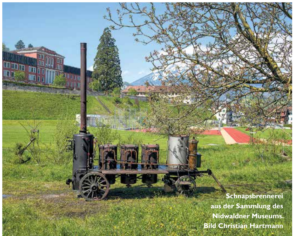
Schnapsbrennerei aus der Sammlung des Nidwaldner Museums.

Im Sinne einer interventionistischen Kunstpraxis treffen im Ausstellungsraum der Leichenwagen aus der hauseigenen Sammlung auf ein Dromedar, eine Schnapsbrennerei auf bestehende fotografische Arbeiten des Künstlers, Sperrmüll, Heugabel und Morgenstern. Müller vertraut auf die Präsenz der Dinge und darauf, in diesen Narration und Erfahrung vorzufinden. Die Auswahl der Objekte ist Ausgangslage für ein Geflecht unterschiedlichster Beziehungen, in dem sich Lokalhistorie mit Kunstgeschichte und der eigenen Biografie verweben. Die Assoziationsketten und Gedankengänge reichen von der dadaistisch-surrealistischen Szene aus dem Film «Entr'acte» (1924), in der ein Leichenwagen von einem Dromedar gezogen und so zum Sinnbild der Avantgarde wird, über die Reinszenierung traditioneller Trauerzüge bis hin zu persönlichen Kindheitserinnerungen des Künstlers. Darüber hinaus verweisen die Heugabel auf die bäuerliche, der Morgenstern auf die kriegerische Vergangenheit der Innerschweiz.