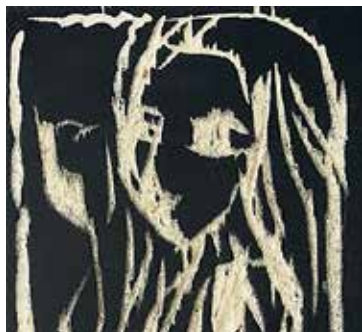
Eugen Bollin: Aufblühen www.talmuseum.ch

Am 11. Juni 2016 öffnet das Tal Museum seine Türen für die Werke des Benediktinerpaters Eugen Bollin (*1939). Im Zentrum der Ausstellung steht eine Werkgruppe aus neu entstandenen Malereien in Öl und aus Holzschnitten. Die beiden Bildmedien scheinen auf den ersten Blick sehr unterschiedlich: Pastose Pinselstriche stehen scharfen Schnitten im Holz gegenüber, facettenreiche Farbtöne treffen auf Schwarz-Weiss-Kontraste. Visuell bilden die Holzschnitte und Ölmalereien zunächst starke Gegensätze; in der Ausstellung im Tal Museum fügen sie sich zu starken Bildgruppen zusammen. Gemeinsam ist den Arbeiten der expressive Ausdruck, die Kraft und Dynamik sowie die Thematik: Kloster, Menschen, Garten, Jahreszeiten. In seinen Arbeiten thematisiert der Künstler das Spannungsfeld zwischen dem Mikrokosmos Kloster und der es umgebenden Aussenwelt. Ein Thema, das Eugen Bollin seit Jahren vertieft. Eugen Bollin selbst schreibt zum Ausstellungstitel: «Aufblühen ist ein alljährliches Ritual der Natur und des Menschen. Blume und Natur partizipieren an der Wiederkehr der Zeit, die ihre Spuren setzt.» Nicole Eller