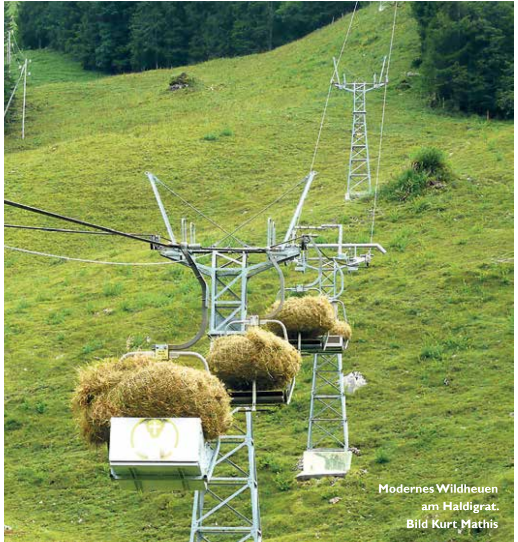
Modernes Wildheuen am Haldigrat.

Haben die lebendigen Traditionen eine Zukunft? Risi: Ja. Rituale zu schaffen und