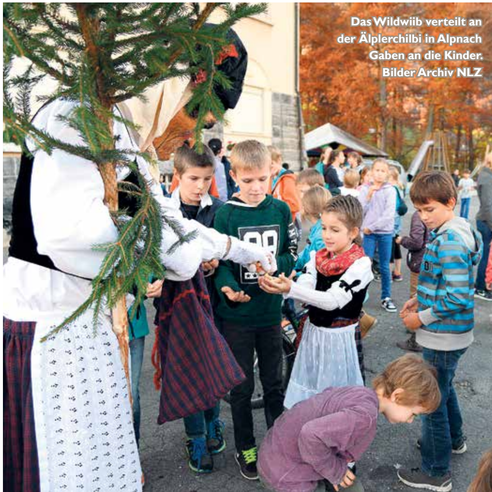
Das Wildwiib verteilt an der Älplerchilbi in Alpnach Gaben an die Kinder.

Mit der Ratifizierung der Unesco-Konvention zur Bewahrung des immateriellen Kulturerbes verpflichtete sich die Schweiz 2008, eine nationale Liste der heute in den verschiedenen Landesteilen ausgeübten Traditionen, Bräuche oder althergebrachten Ausdrucksformen zu erstellen. In der Folge beauftragte der Bund die Kantone, Listeneinträge in Form von thematischen Dossiers auszuarbeiten. Nur in Einzelfällen trat er selber in dokumentarischer Funktion auf, nämlich insbesondere dort, wo eine traditionelle Überlieferung offensichtlich auf die ganze Schweiz ausstrahlte wie beispielsweise beim Jassen, Fondue-Essen oder Schwingen. Daraus entstand ein nationales Verzeichnis mit insgesamt 165 Traditionen. Es wurde im September 2012 online gestellt. Die 28 Dossiers aus der Zentralschweiz verfasste der Engelberger Kulturwissenschaftler Marius Risi. Webadresse der Liste: www.lebendige-traditionen.ch