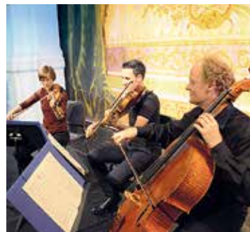
«erstKlassik am Sarnersee» www.erstklassik.ch

Solistinnen und Solisten des Symphonieorchesters des Bayerischen Rundfunks und befreundete Musiker präsentieren auch in diesem Sommer ein hochkarätiges Festivalprogramm in ungezwungener Atmosphäre und einzigartiger Landschaft. Bereits zum neunten Mal geht vom 20. bis 28. August das Kammermusikfestival «erstKlassik am Sarnersee» über die Bühne. «Licht in dunklen Zeiten» lautet der Titel eines der Konzerte. Er passt nicht nur zur Entstehungsgeschichte dieser Werke, sondern auch in die aktuelle Zeit der weltweiten Unruhen und Flüchtlingswellen. Neben dem Genuss wundervoller Meisterwerke der Kammermusik soll auch Neugierde für andere Stile geweckt werden. Nicht nur das Konzert mit vier Schlagzeugen verspricht ein Ereignis der besonderen Klasse, sondern auch «Tanz im Theater» mit Tanz- und Volksmusik. Der Empfang im Festivaldomizil «Alte Krone» in Sachseln sowie die sonntägliche Matinee sind bereits liebgewordene Tradition und ermöglichen den persönlichen Kontakt mit den Musikern. Die Konzerte finden in Sarnen, Engelberg und Flüelirand statt. Elisabeth Melcher