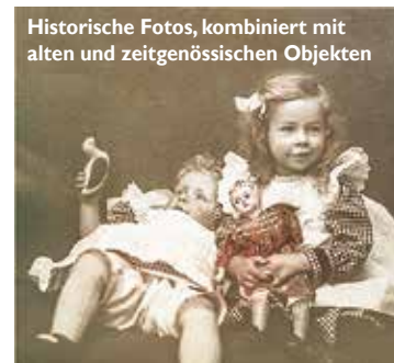
Historische Fotos, kombiniert mit alten und zeitgenössischen Objekten

Solistinnen und Solisten des Symphonieorchesters des Bayerischen Rundfunks und befreundete Musiker präsentieren auch in diesem Sommer ein hochkarätiges Festivalprogramm in ungezwungener Atmosphäre und einzigartiger Landschaft. Bereits zum neunten Mal geht vom 20. bis 28. August das Kammermusikfestival «erstKlassik am Sarnersee» über die Bühne. «Licht in dunklen Zeiten» lautet der Titel eines der Konzerte. Er passt nicht nur zur Entstehungsgeschichte dieser Werke, sondern auch in die aktuelle Zeit der weltweiten Unruhen und Flüchtlingswellen. Neben dem Genuss wundervoller Meisterwerke der Kammermusik soll auch Neugierde für andere Stile geweckt werden. Nicht nur das Konzert mit vier Schlagzeugen verspricht ein Ereignis der besonderen Klasse, sondern auch «Tanz im Theater» mit Tanz- und Volksmusik. Der Empfang im Festivaldomizil «Alte Krone» in Sachseln sowie die sonntägliche Matinee sind bereits liebgewordene Tradition und ermöglichen den persönlichen Kontakt mit den Musikern. Die Konzerte finden in Sarnen, Engelberg und Flüelirand statt. Elisabeth Melcher