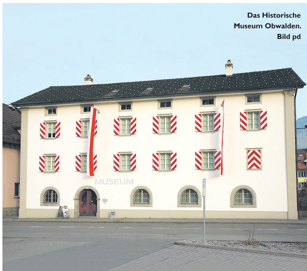
Das Historische Museum Obwalden.

Kritisch gegenüber der Verstaatlichung von Museen äussert sich Kilian T. Elsasser, Ausstellungsmacher und Museumsberater aus Luzern. «Die Erhaltung von Kulturgut ist zwar eine Aufgabe der öffentlichen Hand, die Durchführung hingegen nicht unbedingt», sagt Elsasser. Als Stiftung, Verein oder öffentlich-rechtliche Anstalt könne man flexibler und schneller reagieren, beim Kanton werde alles sofort zum Politikum. Zudem ist eine Stiftung nicht dem politi-