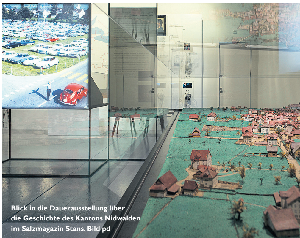
Blick in die Dauerausstellung über die Geschichte des Kantons Nidwalden im Salzmagazin Stans.

Im Gegensatz zu den umliegenden Ländern hat die Schweiz kein örtliches Zentrum, welches mit international bedeutenden Institutionen einen beachtlichen Teil der Museumsbesuche absorbiert. In Österreich beispielsweise finden über 40 Prozent der Museumsbesuche in Wien statt. Die Schweiz hingegen hat mit ihrer kantonalen Kulturhoheit den Vorteil, dass Museen lokal stark verankert sind. Die Menschen vor Ort definieren, was erhaltenswert ist und welche Themen der Öffentlichkeit präsentiert werden sollen. In Ob- und Nidwalden wie auch in der ganzen Schweiz schufen Vereine oder sogar Einzelpersonen Museen, die später oft von der öffentlichen Hand unterstützt werden. Diese Nähe zur Bevölkerung und die interkantonale Konkurrenz machten möglich, dass eine grosse Vielfalt entstand. Die zahlreichen Institutionen bewirken aber auch, dass jedes Museum sein eigenes Gebäude unterhalten und einen Betrieb aufrechterhalten muss. Ein nicht unbedeutender Teil der Ressourcen wird durch die Aufrechterhaltung dieses Systems gebunden, und lediglich ein kleinerer Teil fliesst in die eigentliche Kulturarbeit. Diese Verteilung der Ressourcen auf viele Institutionen bewirkt, dass die meisten Museen unterfinanziert sind und bei der grossen medialen Vielfalt und Konkurrenz der Freizeitveranstaltungen kaum die Möglichkeit haben, richtig wahrgenommen und gut besucht zu werden. Ein Ansatz, diese Zersplitterung aufzu-