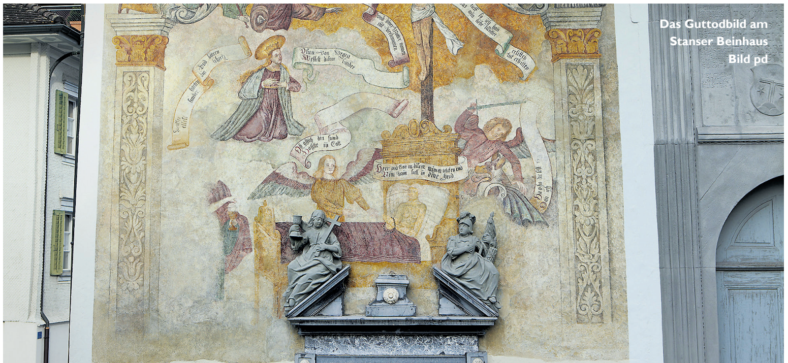
Das Guttodbild am Stanser Beinhaus

Nicht nur im Museum, eingerahmt und hinter Glas, sind Kunstobjekte ausgestellt. Auch draussen im öffentlichen Raum findet sich Kunst – und die macht ganz schön Arbeit.