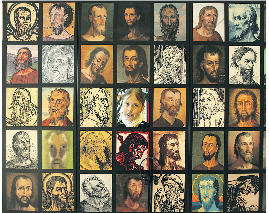
Gesichter des Heiligen in der Ausstellung «Niklaus von Flüe – Vermittler zwischen Welten».

Die einfachste Art, allgemein die Kunst- und Geschichtsmuseen zu stärken, wäre, diesen mehr Mittel zuzuweisen. Ein anderer Weg ist, die vorhandenen Ressourcen auf weniger Institutionen zu verteilen. Eine Möglichkeit wäre dabei eine thematische Aufteilung: Ein Kanton konzentriert sich auf den thematischen Schwerpunkt Kunst, der andere auf die Geschichte. Die zwei verbleibenden Institutionen bräuchten nun weniger Mittel für die Aufrechterhaltung des Systems. Es blieben mehr Ressourcen für die Sammlung, die Vermittlung und die Kommunikation. Die neuen Institutionen würden mit