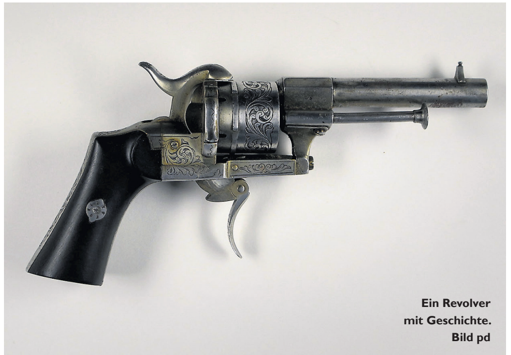
Ein Revolver mit Geschichte.

Der Revolver wird nun für die Inventarisierung ausgemessen, fotografiert und genau beschrieben. Dann wird seine Geschichte Thema. Bei Nachforschung über die Beschlüsse wird klar, dass der funktionstüchtige Revolver der Firma Lefauchaux zwischen 1853 und 1877 in Lüttich hergestellt wurde. Da die belgische Firma nicht mehr existiert, kann man aber nicht in Erfahrung bringen, wie viele Exemplare hergestellt wurden oder im Umlauf sind. Auch die Seriennummer 132592 gibt darüber keinen Aufschluss. Denn im Gegensatz zu heute war den Herstellern früher relativ egal, wer welche Waffe