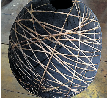
13er-Kunsttreff: Von der Zelle in den Keller www.kunsttreff13.ch