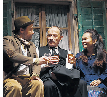
Theater Buochs inszeniert die «Kaländer Girls» www.theater-buochs.ch